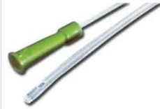
Kateter för sug CH 20 Diamet... 19,00 kr MediStore +29,00 kr frakt