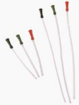
Tappningskateter Nelaton - Ch2... 275,00 kr swemed.se