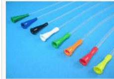
Tappningskateter Nelaton - ch20... 325,00 kr swemed.se