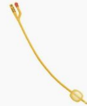
Kateter 2-vägs Rüsch Go... 338,00 kr swemed.se