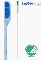
Tappningskateter LoFric Origo -... 981,00 kr swemed.se